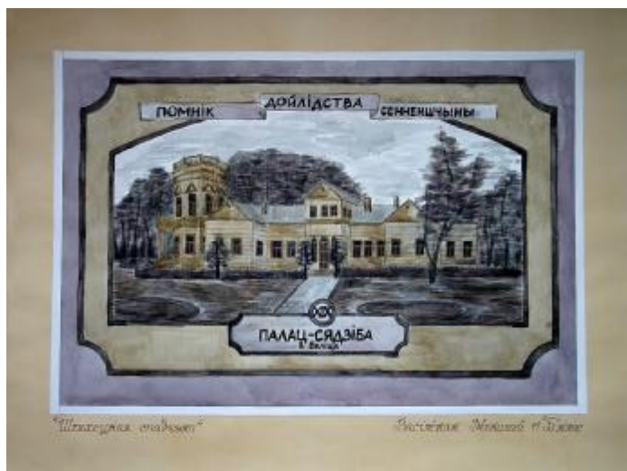
“Шляхецкая спадчына” малюнак вучня 11 класа з мастацкім ухілам СШ №2 Васіленка Мікалая