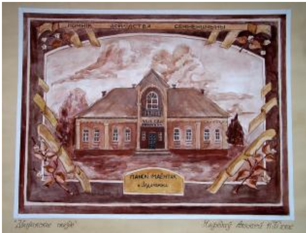
“Дваранскае гняздо” малюнак вучня 11 класа з мастацкім ухілам СШ №2 Няфедава Аляксея