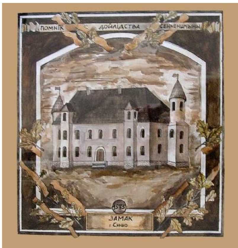
“Замак” малюнак вучня 10 класа з мастацкім ухілам СШ №2 Гарбачова Кірыла

На тэрыторыі, дзе зараз размешчаны фізкультурна-аздараўленчы комплекс, некалі стаяў замак, пабудаваны ў 1573 г. Ён высіўся на ўзгорку, які гараджане называлі Замкавай гарой. Абапал узвышша быў выкапаны роў, запоўнены вадой, што паступала з рэчкі. Цераз роў быў перакінуты пад’ёмны мост, а на гары ўзвышаўся двухпавярховы дом-палац. У ім жыў уладальнік Сянно Дзмітрый Сапега, адзін з самых багатых людзей Вялікага княства Літоўскага.