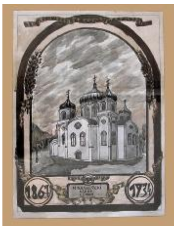
“Мікалаеўскі сабор” малюнак вучня 10 класа з мастацкім ухілам СШ №2 Васіленка Мікалая