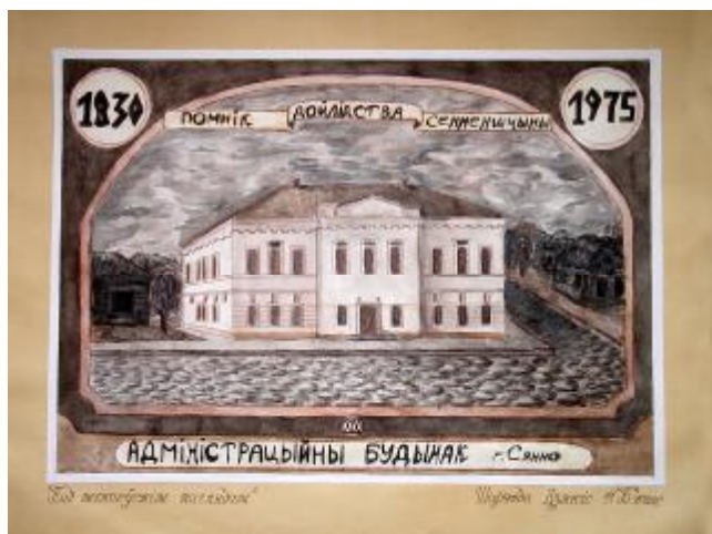
“Пад мікалаеўскім наглядам” малюнак вучня 11 класа з мастацкім ухілам СШ №2 Шарэнда Дзяніса