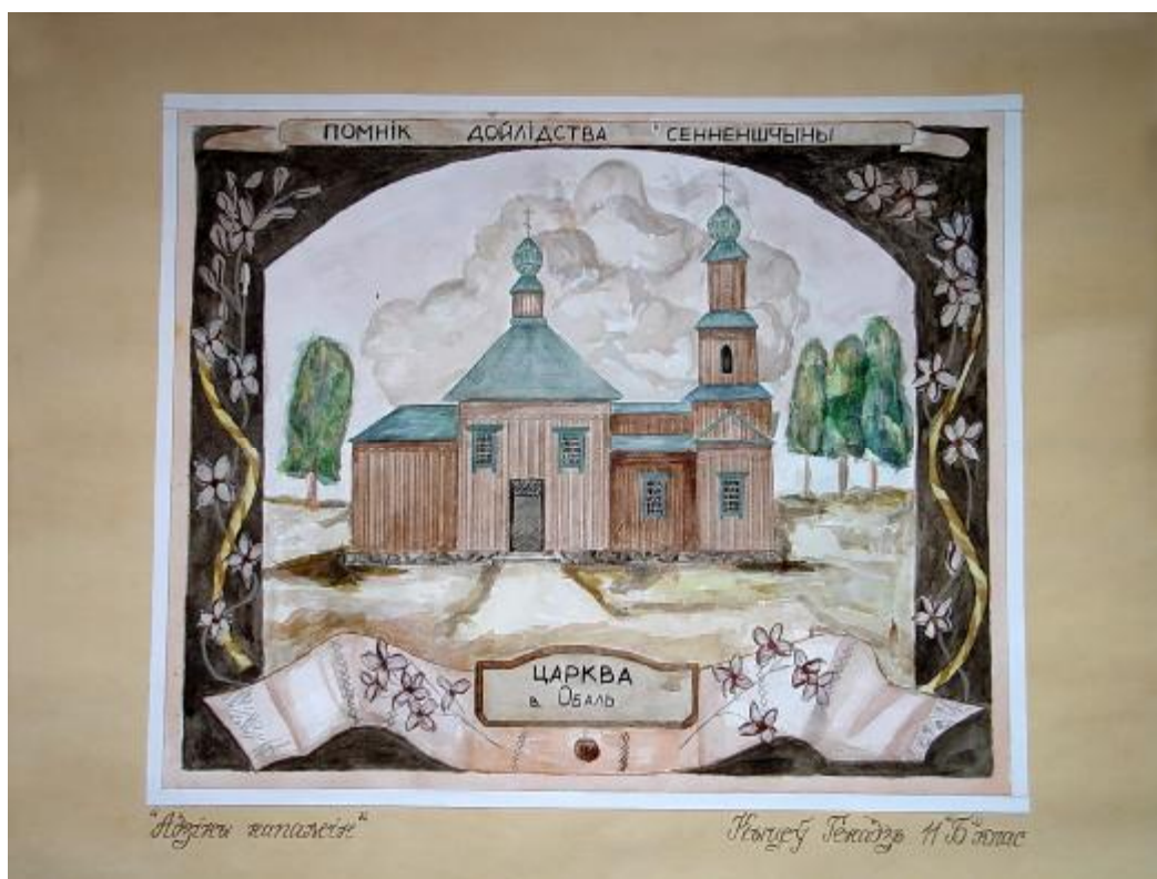
“Адзіны напамін” малюнак вучня 11 класа з мастацкім ухілам СШ №2 Кыцева Геннадзя

Яркім прадстаўніком драўляных архітэктурных помнікаў на тэрыторыі Сенненшчыны з’яўляецца адзіны захаваны на тэрыторыі раена, у в. Обаль (каля Машкан), будынак праваслаўнай царквы. Калісьці, да рэвалюцыі, на тэрыторыі Сенненскага павета было 57 кultaвых помнікаў архітэктурны, захаваны толькі