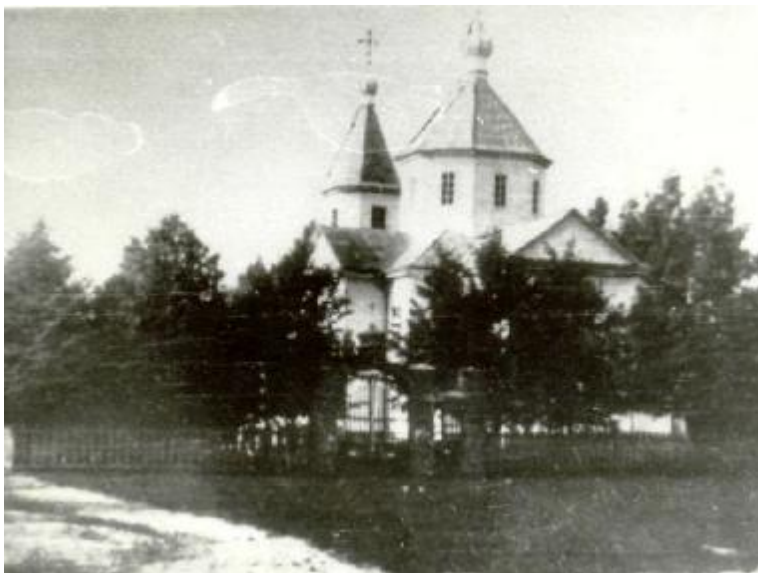
Пакроўская царква ў Сянно. Фота 1907 г.

Пакроўская праваслаўная царква была драўлянай. Яе збудаваў Ксаверый Войцехавіч Пуслаўскі – адзін з уладароў горада. Царква была пабудавана ў народным драўляным стылі з рысамі класіцызму. Гэта быў прыходскі храм, які стаяў у планіровачным цэнтры горада і прызначаўся для вясковага насельніцтва павета, бяднейшых слаёў.