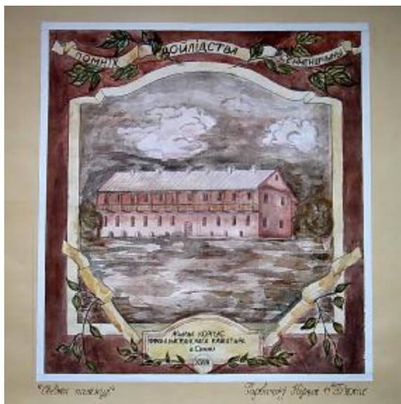
“Сведка памяці” малюнак вучня 11 класа з мастацкім ухілам СШ №2 Гарбачова Кірыла