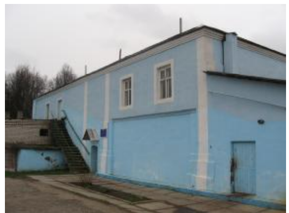
Выгляд самага старажытнага мураванага будынка ў г. Сянно – былога жылога корпуса французскага кляштара пры касцэле. Фота 1998 г.

Францысканцкі ордэн быў вядомы яшчэ ў 1223 г. У 1517 г. яго члены раздзяліліся на канвентуальных (чорных) і бернардзінцаў (карычневых), ад якіх пазней, у 1525 г., аддзяліліся капуцыны (вострыя капюшоны).