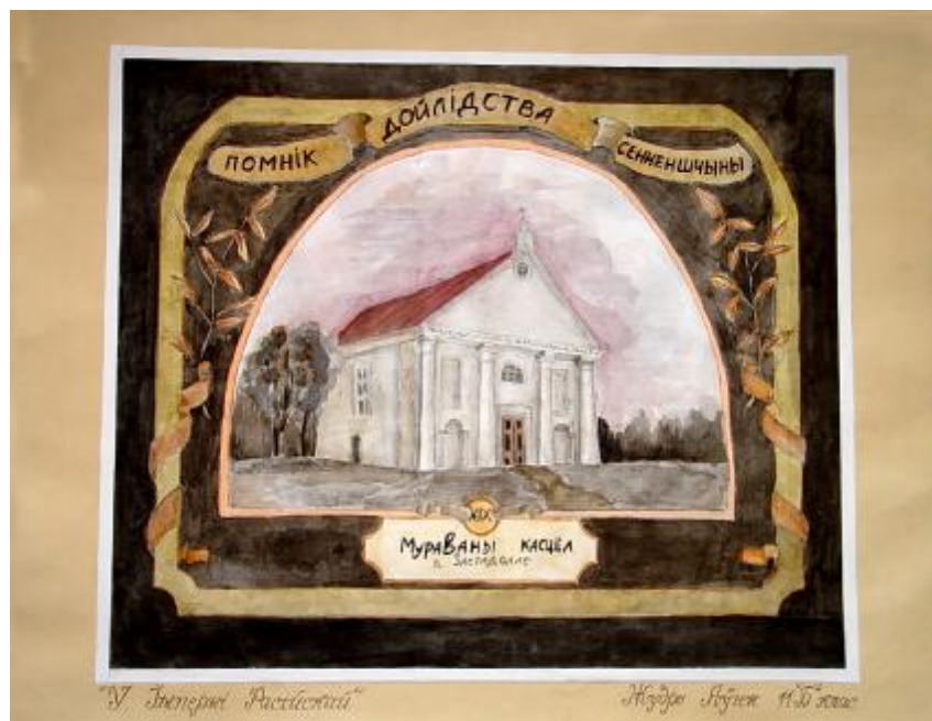
“У Імперыі Расійскай” малюнак вучня 11 класа з мастацкім ухілам СШ №2 Жудро Яўгена

Гэты помнік з’яўляецца адзіным каменным архітэктурным збудаваннем калівага дойдства каталіцкай канфесіі, другі – больш значны і багацейшы ў Сянно быў знішчаны ў 1962 годзе.