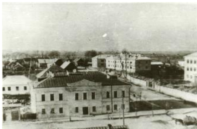
Адміністрацыйны будынак. Фота 1961 г.

З другой паловы XVIII стагоддзя ў архітэктурцы стаў пашырацца новы стыль – класіцызм. Далучэнне беларускіх зямель да Расіі супала з разгортваннем планіровачных работ у імперыі, што выклікала перапланіроўку населеных пунктаў. Першыя праекты ўпарадкавання планіроўкі былі распрацаваны і зацверджаны ў 1778 годзе і датычыліся Віцебска, Полацка, Оршы, Гарадка, Дрысы і Сянно. Пры перапланіроўцы асабліва ўвага надавалася рэканструкцыі гарадскіх цэнтраў. Яны набывалі буйнамаштабны прасторавы характар. Галоўнымі кампанентамі забудовы станавіліся новыя адміністрацыйныя і грамадскія будынкi.