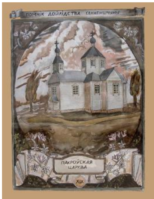
“Пакроўская царква” малюнак вучня 10 класа з мастацкім ухілам СШ №2 Гарнака Яўгена