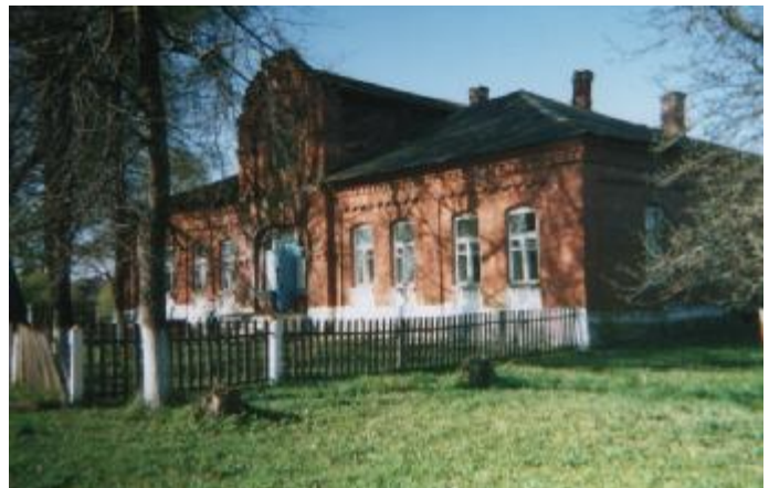
Сучасны выгляд маентка ў в. Задарожжа

З даўніх часоў не шмат помнікаў архітэктуры каменнага доўлідства захавалася на тэрыторыі сучаснага Сенненскага раёна. У асноўным жылыя сялібы будавалі з дрэва, бо гэта быў танні, шырока распаўсюджаны матэрыял. Звычайныя сялібы сялян больш-менш вядомы, а вось сялібы шляхты, памешчыкаў Сенненскага павета вядомыя менш. Гэта тлумачыцца тым, што ў часы рэвалюцыйных віхур шмат будынкаў было знішчана, а астатнія перароблены на іншы лад. Больш трывалымі былі будынкi буйных памешчыкаў, бо сродкі дазвалялі будаваць іх з цэглы.