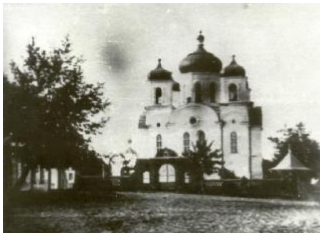
Мікалаеўскі сабор. Фота 1907 г.